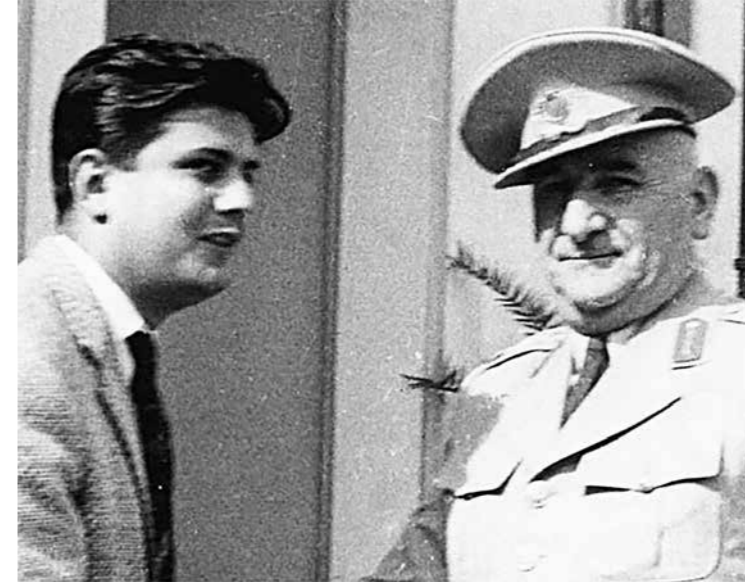
Özgüden 27 Mayıs 1960 sabahı Orgeneral Cemal Gürsel ile

Ayrıca, 1 Aralık 1960'ta Türk Ceza Kanunu'nun 481. maddesi değiştirilerek gazeteciye, mahkemeye verilmesi hâlinde, iddiasını ispatlama hakkı tanındı.