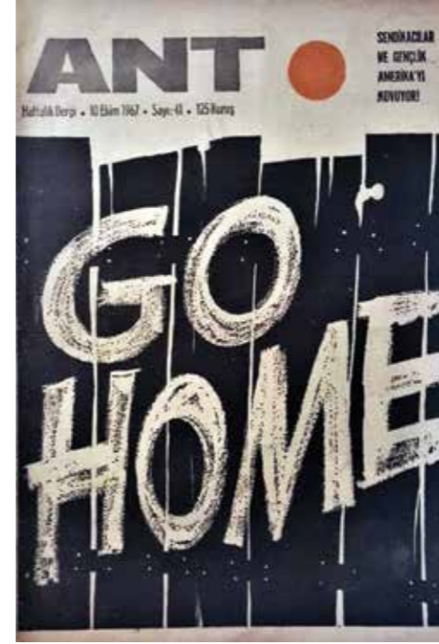
Ant dergisinin 10 Ekim 1967 tarihli "Go Home" başlıklı kapağı.

1967'nin Eylül ve Ekim aylarında, ABD'nin Türkiye'deki varlığını güçlendirme yolunda yeni girişimler birbirini kovalıyordu. Doğu Anadolu'ya nükleer mayınlar yerleştirilmesi konusunda ABD Savunma Bakanı Mac Namara ile Ankara'da yeni pazarlıklar yapılmış, NATO'nun düzenlediği bir tatbikat için Vietnam'da savaşmış binlerce ABD askerî havadan Anadolu topraklarına indirilmişti. ABD üslerindeki işçi grevleri de NATO Komutanlığı'nın isteği üzerine hükümet tarafından ertelenmişti.