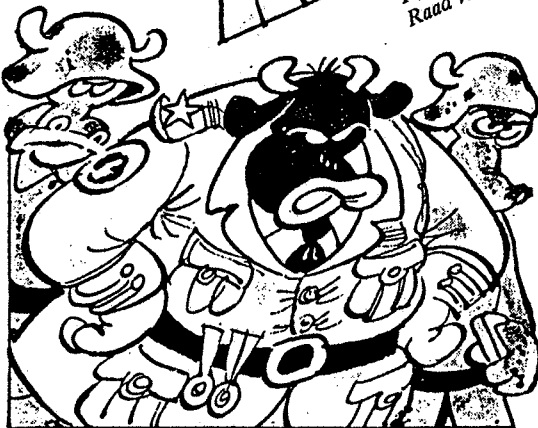
...Na de resolutie van de Parlementaire Vergadering van de Raad van Europa!