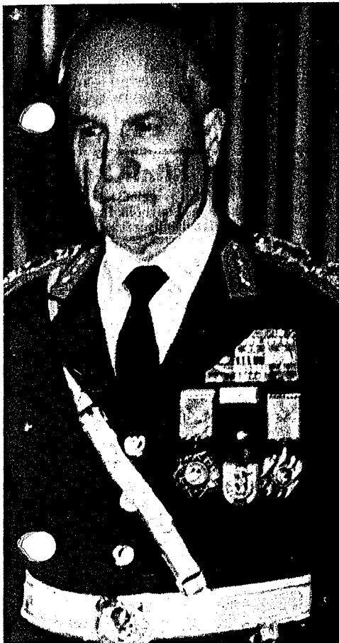
12 september 1980 Chef der putschisten

7DE JAAR • PRIJS: 50 BF • JAARABONNEMENT: 500 BF • PCR: 000-1168701-45 • INFO-TURK - 13/2, Ch. M. WISERPLEIN - 1040 BRUSSEL • TEL: (32-2) 230 34 72 UITGEVER: TURKS COLLECTIEF VOOR UITGAVE EN VERSPREIDING • ISSN 0770-9161