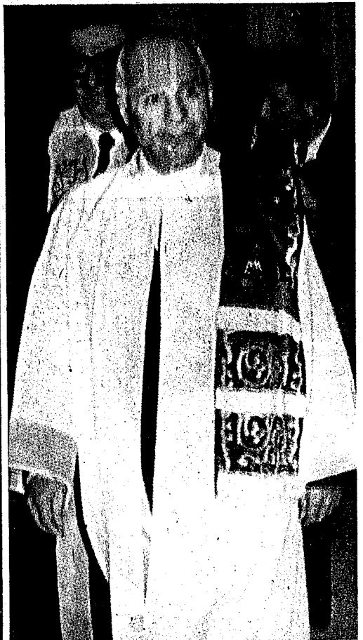
14 januari 1983 "Doctor Honoris Causa"