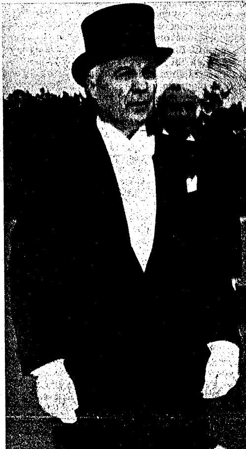
7 november 1982 "President van de Republiek"