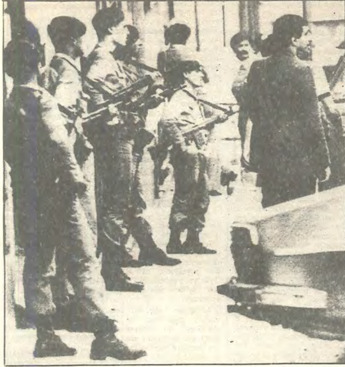
Fotoğraflı "arama listeleri" ve sıkıyönetim çağrılılarıyla "sayın muhbir vatandaşlar"ın yine göreve davet edilmesi, tıpkı 9 yıl önceki 12 Mart uygulamalarını yansıtıyor ve bu "asayiş operasyonundan resimler Avrupa gazetelerinde yer alıyor.