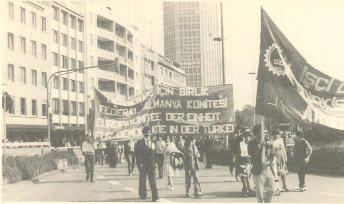
Faşist askeri cuntayı protesto etmek üzere Federal Almanya'da bulunan Türkiyeli örgütlerin 27 Eylül Cumartesi günü Köln'de düzenledikleri yürüyüşe Demokrasi İçin Birlik - Federal Almanya Komitesi de katıldı

Bu ortak yürüyüşün ilk hazırlık toplantısına FİDEF de katılmış, fakat cunta'n- nın FAŞİST CUNTA olarak ni- tellenmesine karşı çıkarak eylem birliğinden çekilmiş- tir.