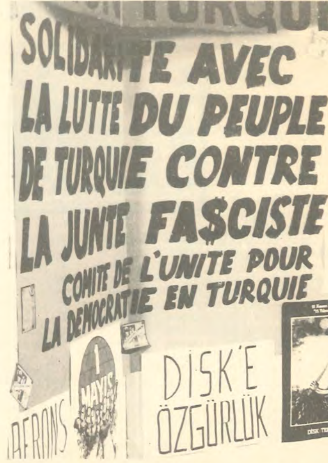
Liège'de yapılan La Cité Gazetesi Bayramı'nda De- mokrasi İçin Birlik Komitesi standı: "Türkiye hal- kının faşist cuntaya karşı mücadelesiyle dayanışma"