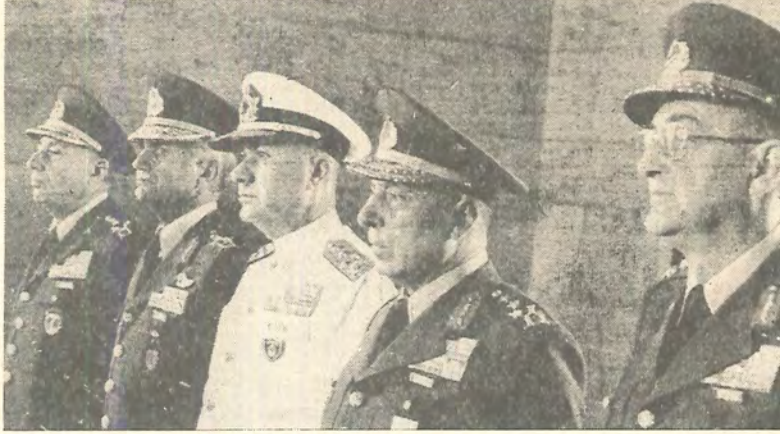
Cunta şefi general Evren, dört kuvvet komutanı ve NATO'nun kilit adamı Haydar Saltık (en sağda), NATO'nun ve IMF'nin "istikrar planı"na kanla, hapisle, işkenceyle uyguluyorlar