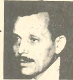
17 NİSAN 1980 TARİHLİ CUMHURİYET:

IMF Heyeti uzmanları, hükümetin önerisiyle, Türkiye Başbakanı Denizci'le gizli bir görüşme yaptılar, ücretlerin dondurulmasını istedikler.