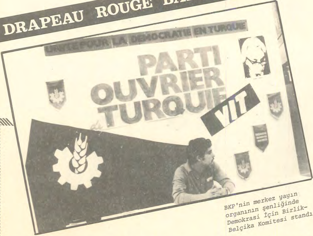
BKP'nin merkez yayın organının şenliğinde Demokrasi İçin Birlik-Belçika Komitesi standı