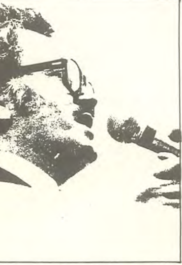
DİSK'İN İLK BAŞKANI TÜRKLER (İşçi sınıfının şehidi oldu)

Bugün DİSK yöneticileri Sıkıyönetim mahkemesinde ve hergün durmaksızın yeni tutuklama istemleri ve tutuklama listeleri bunlara ekleniyor.