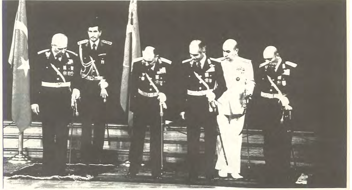
MİLLİ GÜVENLİK KONSEYİ BAŞKANI ORGENERAL KENAN EVREN, BERABERİNDE KONSEYİN DİĞER ÜYELERİ OLDUĞU HALDE YAPTIĞI YURT GEZİSİNDE, CUNTANIN FAŞİSTLİĞİNİ ÇEŞİTLİ KONUŞMALARıyla SOMUTLAŞMIŞ BULUNUYOR. EMEKÇİ KİTLELERİ KEMER SIKMAYA ZORLARKEN KENDİ ŞEREFİNE JET FİLOLARI UÇURTARAK MİSLİ GÖRÜLMEMİŞ BİR İSRAF ÖRNEĞİ DE VERDİRTEN EVREN'İN KONUŞMASINDAN, CUNTA'NIN NİTELİĞİNE AÇIKLIK KAZANDIRAN KISIMLARI SUNUYORUZ:

Son bir nokta daha var. Cunta'ya ve onunla mücadeleye ilişkin olarak yukarıda özetlenen tesbitler, "Cunta'nın nasıl bir yön izleyeceği"ni de açıklıkla ortaya koyuyor. Bu tesbitler ışığında cuntanın yönüne ilişkin gölgesi, kuşku olan ne kalıyor ki? Cuntanın yürüttüğü iç ve dış politikanın "kimi ordu çevrelerinde hoşnutsuzluk yarattığı" görüşüne gelince, bu, Cunta'nın izlediği ve izleyeceği yön sorusundan apayrısı, onunla ilintisi olmayan bir konudur. Böyle bir durum olgunlaşır, "ordu içinde yurtsever güçlerin bir politik güç konumuna yükselmesi" gerçekleşirse, bu gelişme Cunta dışında ve ona karşı bir gelişme olur ve bugünkü cuntanın yönünü belirleme değil, onu devirme sonucunu verebilir ancak. Bu ayırımı yapmakta ve gözlemekte çok dikkatli ve titiz davranılmalıdır. Böyle davranılmaz da iki olgu birbirine karıştırılır ve bunun sonucu cunta'nın izlediği politik çizginin olumlu yönde değişebileceği vehmine kapılırsa, "esnek politika" uygulama tutumu cuntaya karşı mücadelesinin ağırdan alınması, gevşemesi noktasına götürebilir. Oysa gün, tüm demokratik güçlerin, bir an önce toparlanıp cuntaya karşı en güçlü, ödünsüz bir mücadeleyi verebilmeleri günüdür.