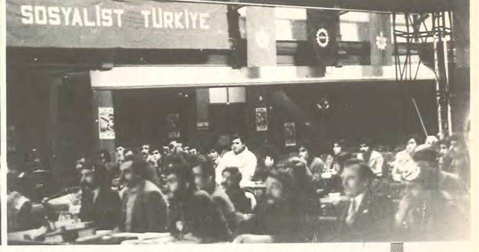
Demokrasi İçin Birlik 1. Avrupa Genel Kurulu salonuna onur konuğu olarak girenken TİP Genel Başkanı Behice Boran tezahüratla karşılanıyor (solda), 7 ülkeden gelen Demokrasi İçin Birlik delegeleri toplantı halinde (sağda) Salonunda TİP ve DİSK bayraklarının yanısıra Genç Öncü bayrağı da yer alıyordu

"Daha güçlü bir örgüt, daha etkin bir mücadele için ileri!"