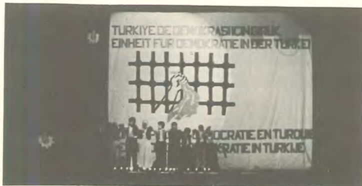
Düsseldorf İşçi Derneği çocuk topluluğu

"Tüm ülkede halk perişan. Doğu ve Güneydoğu Anadolu'da çifte baskı ve sömür-