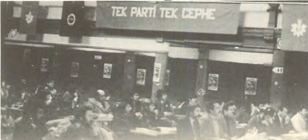
Genel Kurul çalışmalarını sırasında ağırlık noktasını birlik konusu oluşturuyor, "Tek Parti-Tek Cephe" dövizini bu uğurda mücadele kararlılığını simgeliyordu

- Türkiye'de bugünkü dikta yönetimi hüküm sürdüğü sürece, yurt dışındaki Türkiye devlet misyonlarının Türkiyeliler işçilerin sosyal ve kültürel yaşamları ve hukuki statüleri üzerindeki her türlü müdahaleleri önlenmelidir.