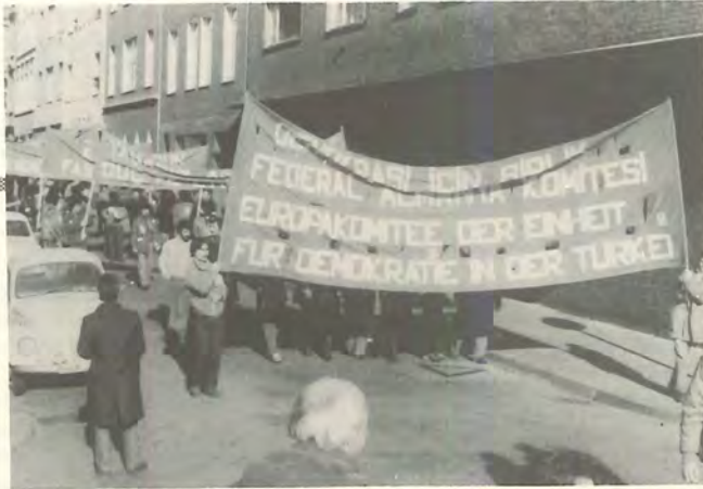
DİB Federal Almanya Örgütü üyeleri Köln Yürüyüşünde